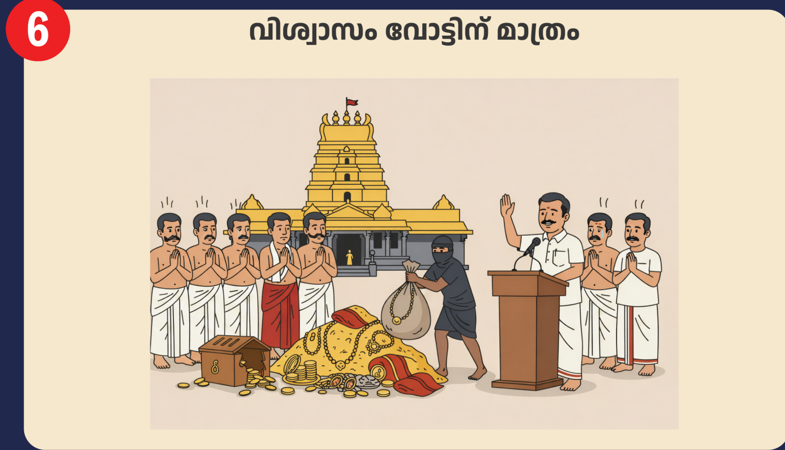
6 വിശ്വാസം വോട്ടിന് മാത്രം എംഎൽഎയ്ക്ക് ശബരിമല ഒരു ആരാധനാലയമല്ല. ഒരു വോട്ട് വിഷയം മാത്രമാണ്. യുവതീപ്രവേശന സമയത്ത് ഭക്തരോടൊപ്പം നിൽക്കാതെ വിശ്വാസി സമൂഹത്തെ വഞ്ചിക്കുകയായിരുന്നു ഈ നേതാവ്.