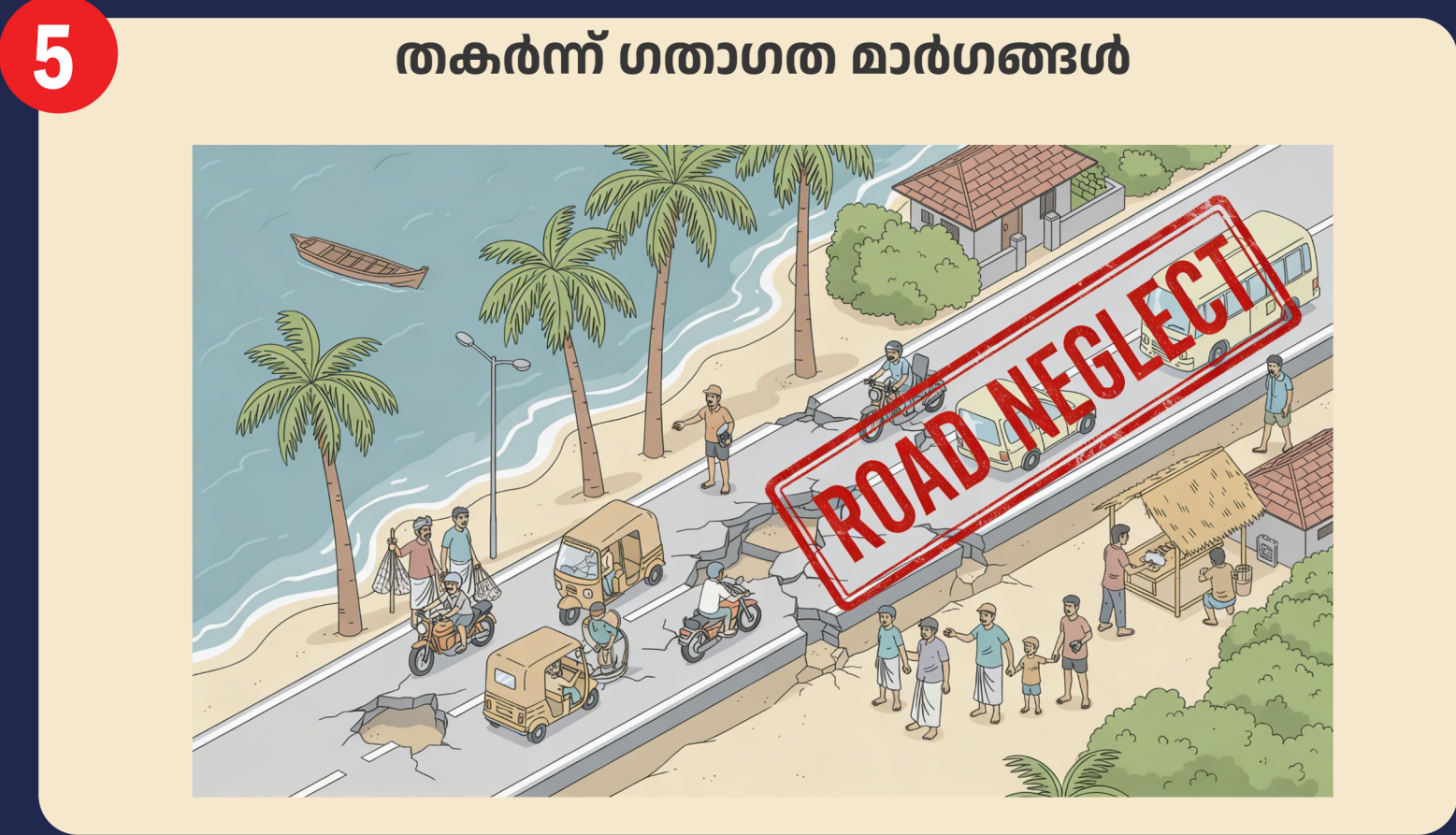
5 തകർന്ന് ഗതാഗത മാർഗങ്ങൾ അരിയല്ലൂർ ബീച്ച് റോഡ് തകർന്നു കിടക്കുന്നു.