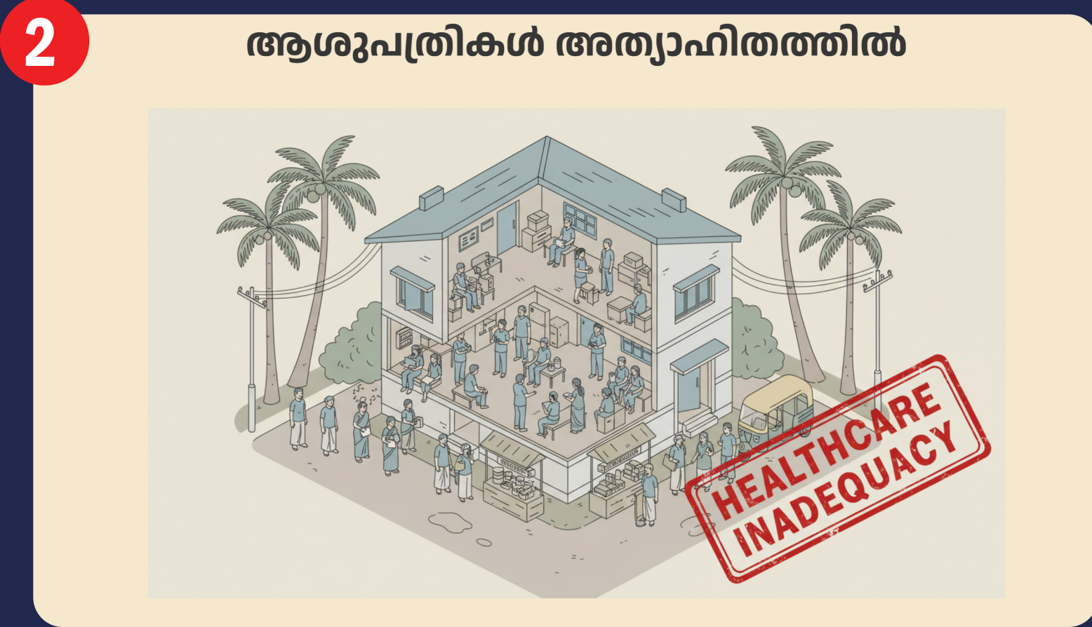
2 ആശുപത്രികൾ അന്യാഹിതത്തിൽ മണ്ഡലത്തിൽ മികച്ച നിലവാരത്തിലുള്ള സർക്കാർ ആശുപത്രികളില്ല. കിടത്തി ചികിത്സയും രാത്രികാല OP സൗകര്യങ്ങളും ഇല്ല.