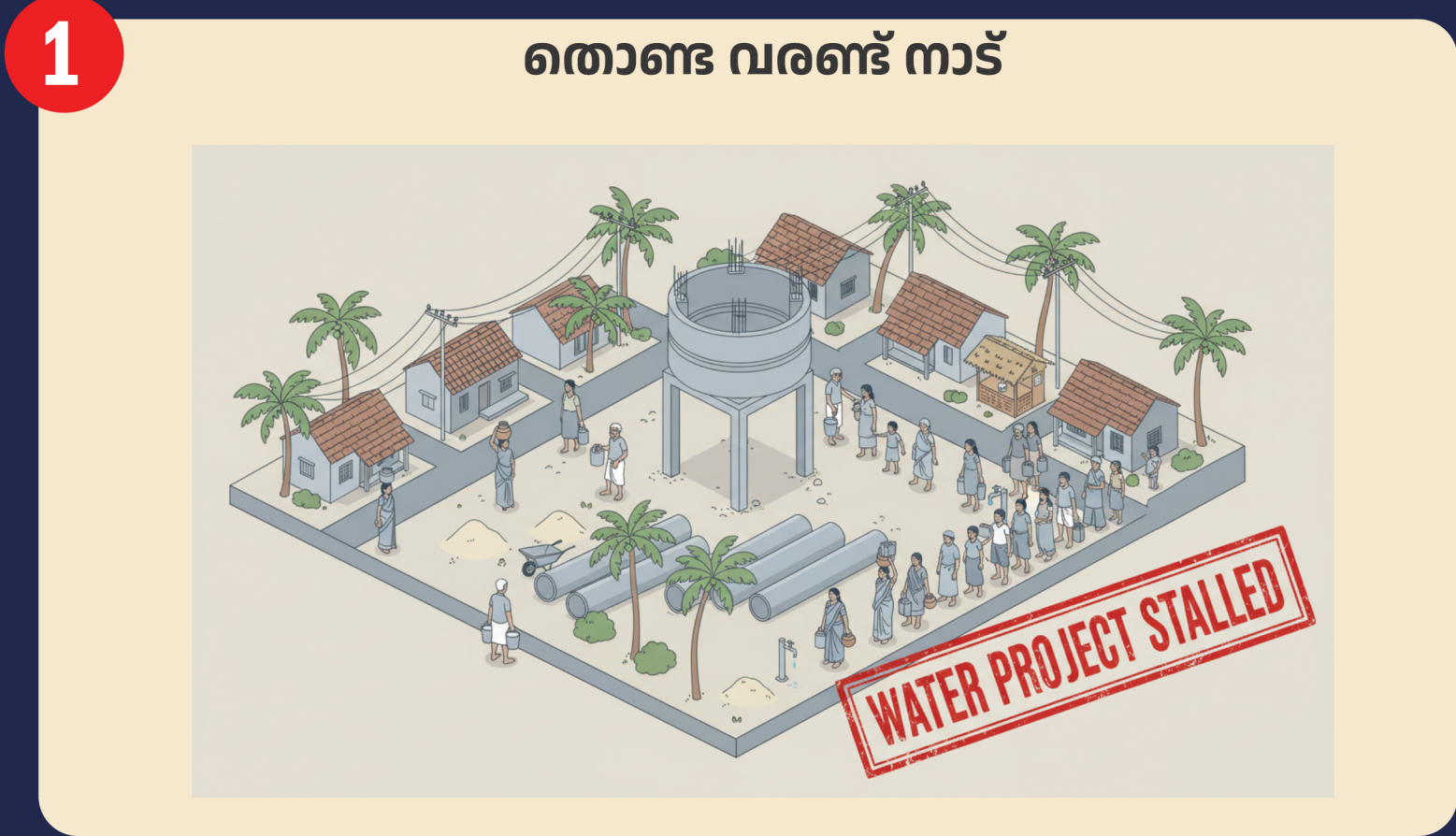
1 തൊണ്ട വരണ്ട് നാട് മണ്ഡലത്തിൽ കുടിവെള്ളം ലഭ്യമാക്കാനുള്ള പദ്ധതികൾ തടസ്സപ്പെട്ടു കിടക്കുന്നു.