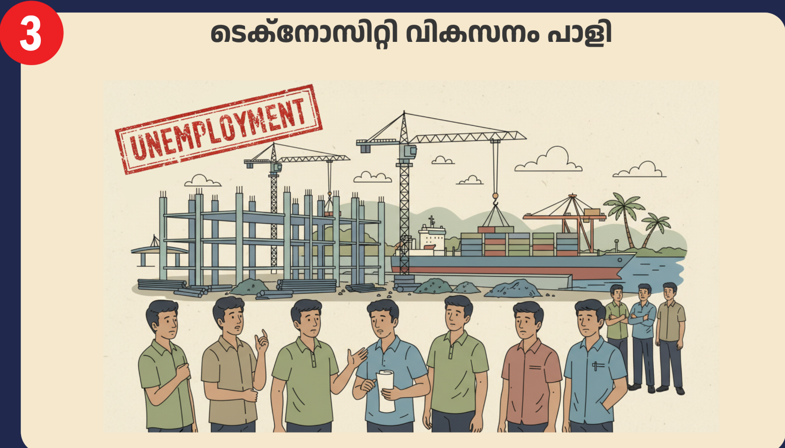
ടെക്നോസിറ്റി വികസനം പാളി

നെടുമങ്ങാട്ടെ മലഞ്ചരക്ക് കർഷകർക്ക് സഹായമില്ല; ഉൽപ്പന്ന ശേഖരണത്തിനോ മുല്യവർദ്ധിത ഉൽപ്പന്നങ്ങളാക്കാനോ നടപടികളില്ല. എം.എൽ.എയുടെ അവഗണനയും വികസനമില്ലായ്മയും.