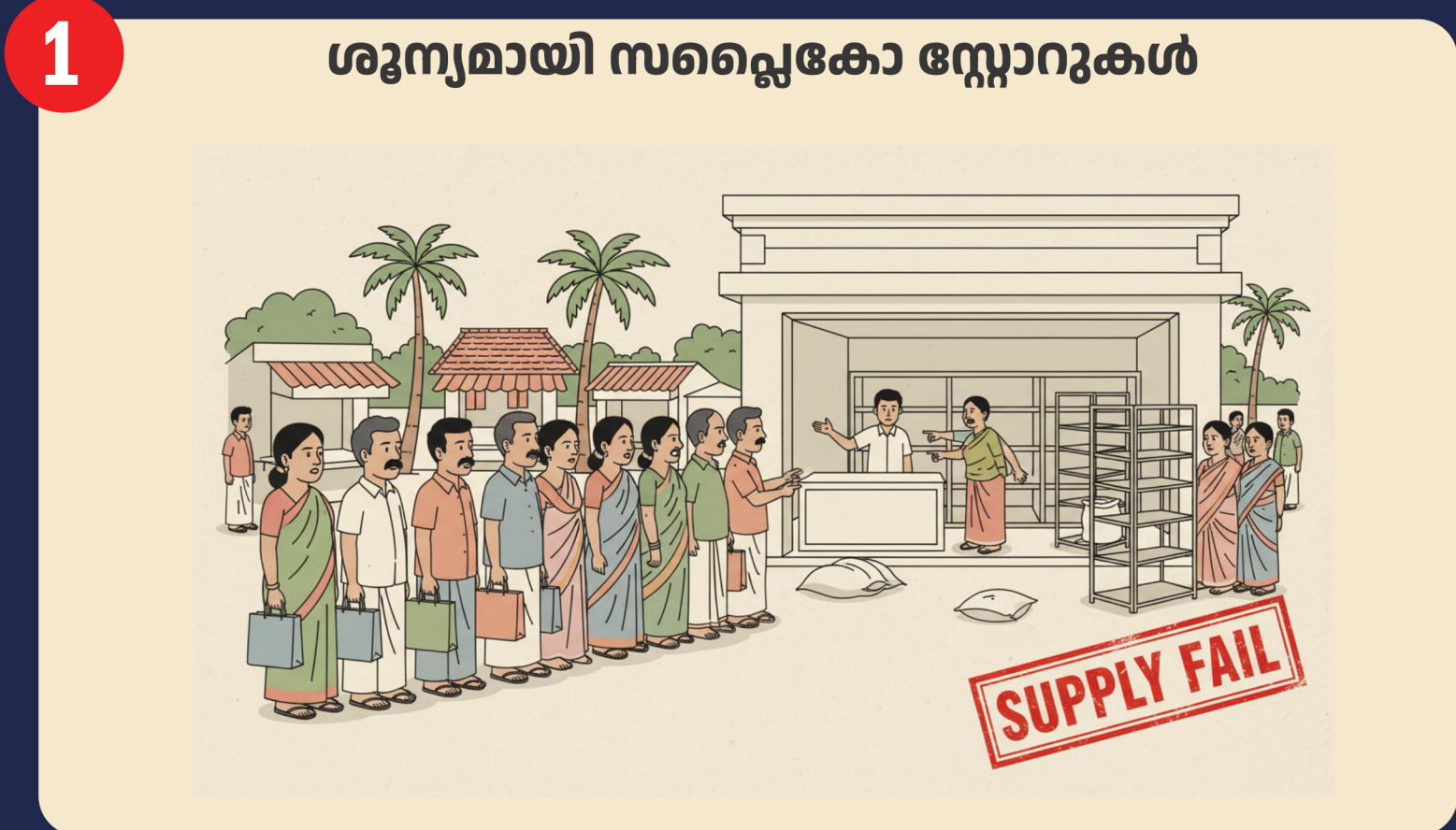
ശൂന്യമായി സപ്ലൈകോ സ്റ്റോറുകൾ

സിവിൽ സപ്ലൈസ് മന്ത്രി പരാജയം; തിരഞ്ഞെടുപ്പ് കാലത്തൊഴികെ സപ്ലൈകോ സ്റ്റോറുകൾ സാധനങ്ങളില്ലാതെ ശൂന്യമാണ്. വിതരണ ശൃംഖല പൂർണ്ണമായും തകർന്നു.